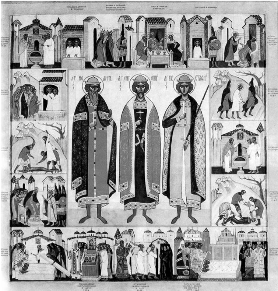
Святые мученики Антоний, Иоанн и Евстафий, в Вильне пострадавшие. Икона