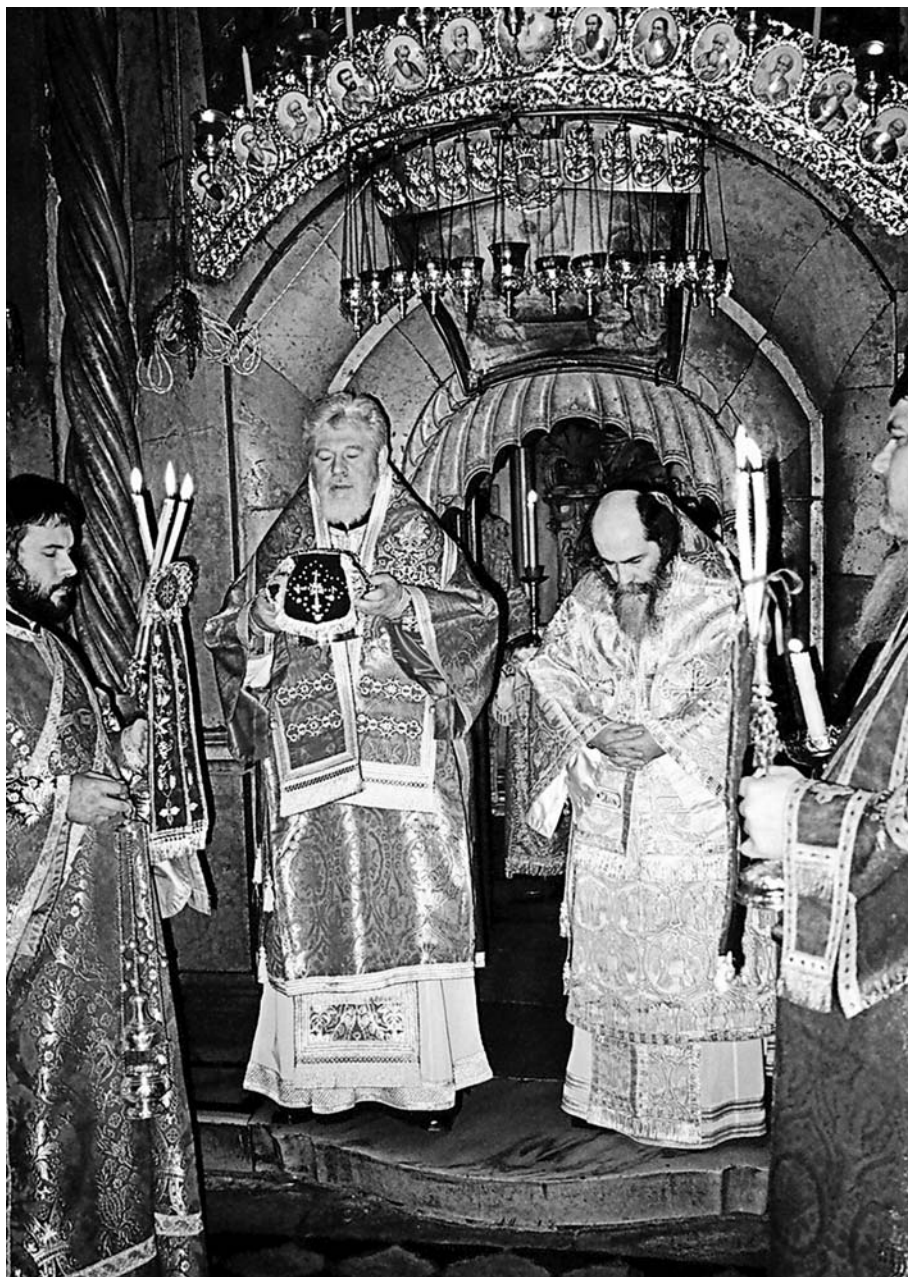
Божественная литургия на Гробе Господнем. Архиепископ Самарский и Сызранский Сергей и архиепископ Фаворский Феофил, ныне - Патриарх святого града Иерусалима и всея Палестины. Май 2005 г.