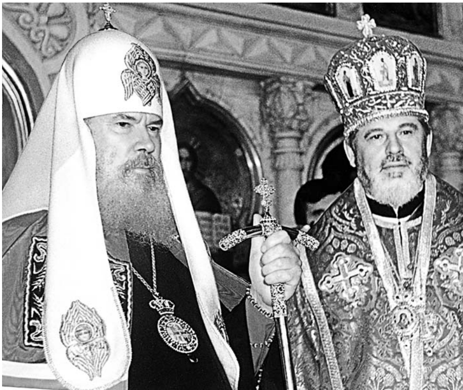
Патриарх Алексий II во время своего визита в Самару. Октябрь 1999 г.

и личностями они были цельными, жертвенными. Важную роль в воспитании таких людей играло чтение Житий святых в семейном кругу. Укоренившаяся благочестивая традиция помогала насмотреться духовно, явственнее проявлялись чувства сострадания, любви и близости к Богу. И сама атмосфера наполнялась Божественным присутствием.