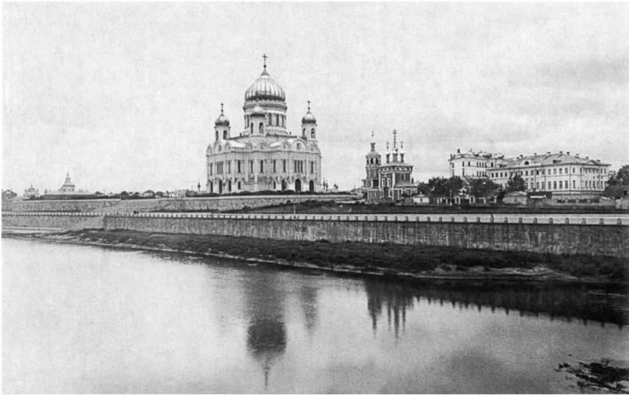
Храм Христа Спасителя

споиц главнѣи каѳедральнѣи храм нашей империи - Успенский собор. Там хранятся все святыни Русской Православной Церкви: частица нешвенного хитона Господа нашего Иисуса Христа, часть древа Честнаго Живоворящего Креста Господня, знаменитая Владимирская икона Божией Матери и находятся усыпальницы московских святителей Пепра, Иова, Гермогена. А вон та самая высокая златоглавая колокольня называется Иван Великий.