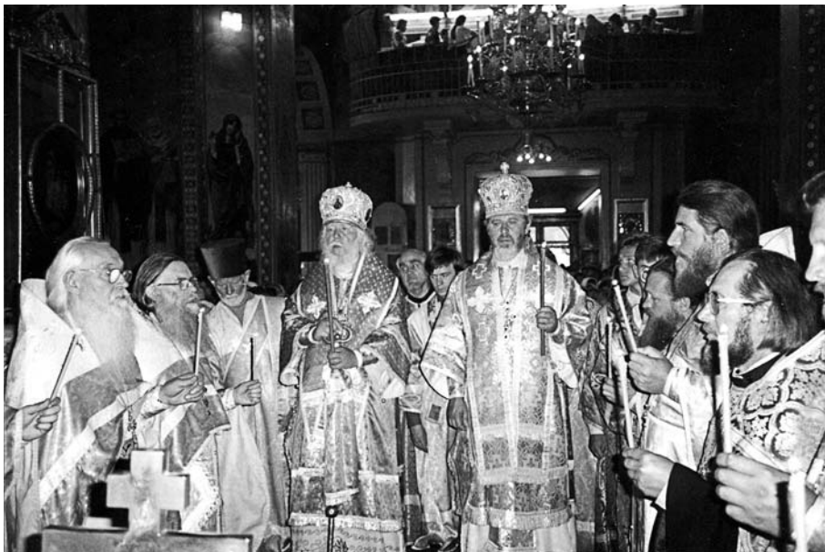
Соборное служение в день памяти митрополита Мануила (Лемешевского)

Хочу привести слова одного священномученика о счастье: «Счастье - это умение радоваться тому, что ты имеешь». Поэтому никогда не следует о своих грехах смущаться, но всегда должно, взирая на Бога, подниматься и снова шествовать за Христом.