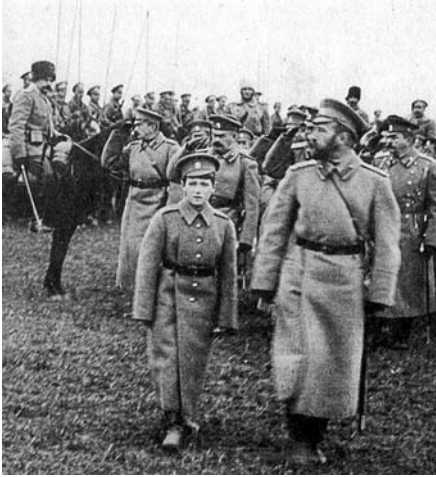
Николай II и Цесаревич Алексей на передовых позициях

по потеряли 1 200 000 убитыми. В окопах не хватало патронов и снарядов. В некоторых батальонах винтовку выдавали на двоих. Сказалась неподготовленность России к войне. Государь, патриоты России это понимали и были готовы прудиться не покладая рук на благо Отечества, до окончательной победы над врагом. Но и враг не дремал.