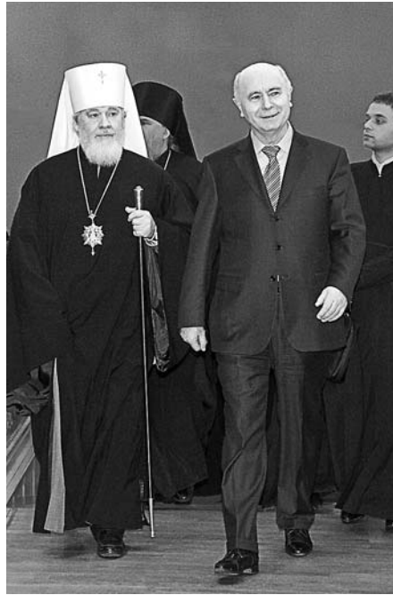
Митрополит Самарский и Сызранский Сергей и губернатор Самарской области Николай Иванович Меркушкин на Рождественском концерте в Самарском академическом театре оперы и балета. Январь 2013 г.

- Мы всегда в ответе перед Богом, и вера даёт нам силы для преодоления любого испытания. И я, несовершенный человек, должен проходить «проверку на прочность» всю жизнь. Что помогает следовать намеченным курсом? - Совещую как можно чаще заниматься полезным для души делом, например, читать Евангелие, что-либо из святоотеческого наследия. Не случайно у наших предков и семьи были крепкие,