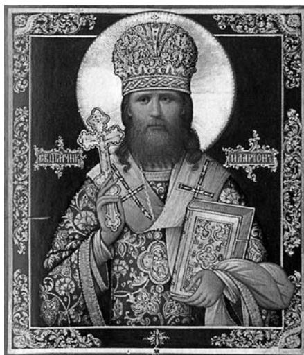
Сщмч. Иларион (Троицкий). Икона. 1999 г.

на и приговорен к трем годам концлагеря. В 1926 г. свт. Иларион возглавил служение пасхальной заутрени на Соловках. Кроме того, он являлся одним из авторов «Памятной записки соловецких епископов» о тяжелом положении Православной Церкви в СССР. 19.11.1926 г. приговорен ко второму лагерному сроку на три года, по окончании которого приговорен к трем годам ссылки в Казахстан. Скончался по пути в ссылку в Петроградской тюремной больнице от тифа. Погребен на кладбище Санкт-Петербургского Новодевичьего монастыря. Прославлен Архиерейским Собором РПЦ 2000 г.