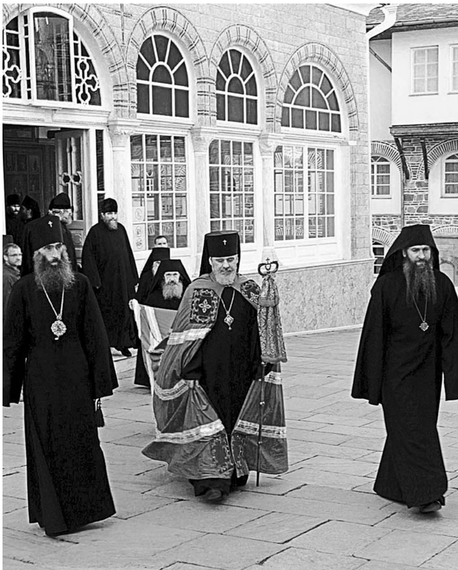
Архиепископ Самарский и Сызранский Сергей в русском Свято-Пантелеимоновом монастыре на Святой Горе Афон. Октябрь 2002 г.

- А о чём больше всего болит у Вас сердце, если говорить о России? - Меня, как и большинство сограждан, поражают масштабы коррупции, безответственность власти предрержащих чиновников, их откровенный цинизм по отношению к нашему народу. Это болью отзывается в сердце, и понимаешь, что кроме веры и молитвы, дру-