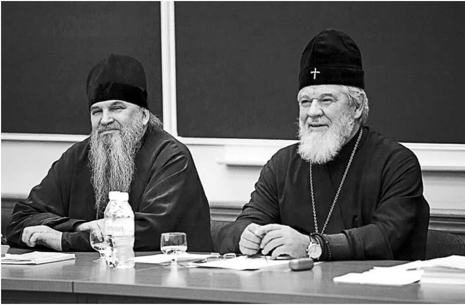
Архиепископ Самарский и Сызранский Сергей и архимандрит Георгий (Шестун) на XX Международных Рождественских образовательных чтениях. Москва, январь 2012 г.

бы туристы могли полюбоваться на такую красоту. В этом тоже заслуга Владыки.