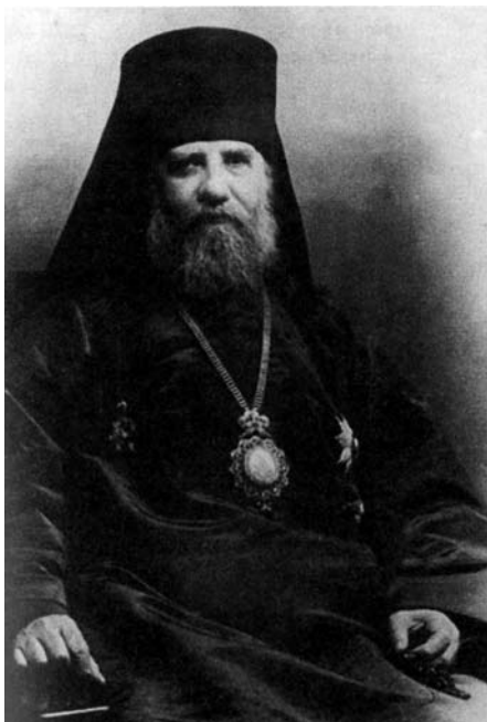
Архиепископ Виленский и Литовский Тихон. 1915 г.

местечках. Казалось, внешне все говорило о нерушимости спокойствия и благополучия здешних мест, но шел 1914 год, явившийся началом первой мировой войны, началом великих испытаний и потрясений для России.