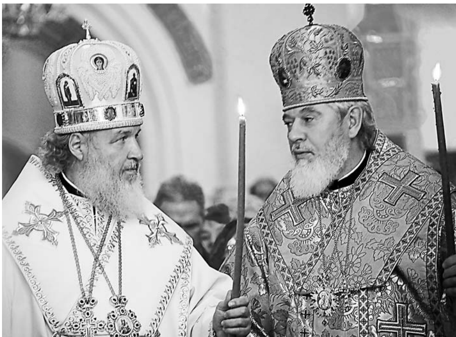
Митрополит Смоленский и Калининградский Кирилл - будущий Патриарх Московский и всея Руси - во время посещения Самары. Октябрь 2008 г.

- Интересно, по какому «домострою» складывались отношения в Вашей семье, Владыка? Кто был её центром, мама или отец?