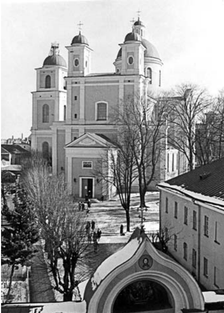
Свято-Духов монастырь. Храм Св. Духа, где почивают мощи свв. угодн. Антония, Иоанна и Евстафия. г. Вильнюс