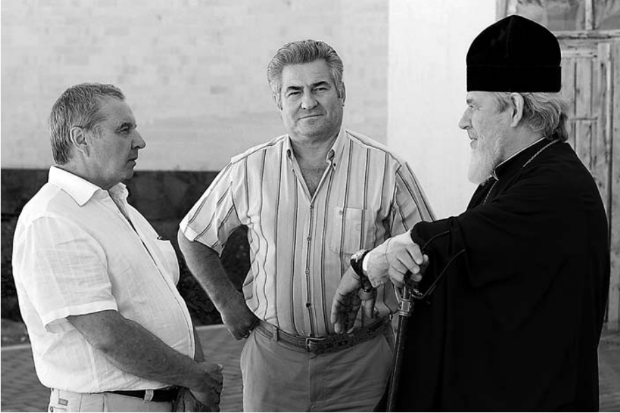
Архиепископ Самарский и Сызранский Сергей, В.А. Сойфер и Г.П. Котельников на собрании Совета ректоров вузов Самарской области в Свято-Богородичном Казанском мужском монастыре (с. Винновка. Июль 2010 г.)