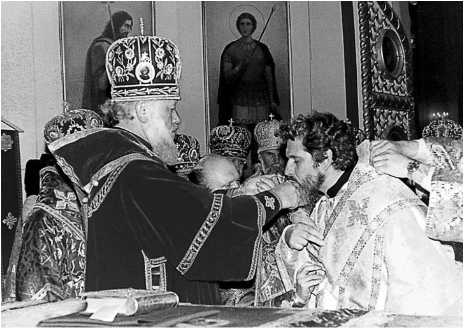
Хиротония Владыки во епископа Азовского на праздник в честь иконы Божией Матери «Живоносный Источник». Рукоположение возглавил митрополит Ростовский и Новочеркасский Владимир (Сабодан), ныне — Блаженнейший митрополит Киевский и всея Украины, при участии четырнадцати архиереев. Кафедральный собор Рождества Богородицы Ростова-на-Дону. 5 мая 1989 г.

академию и семинарию, я был у него иподиаконом в течение всего периода ректорства и всегда старался как-то подражать ему, видя перед собой такую цельную, сильную личность. К тому же он блестящий оратор и сочетает в себе немало других положительных качеств. Не только я, но и мои товарищи уважали его не только за это, но и за простоту, человечность, опеческую заботу о нас, студентах.