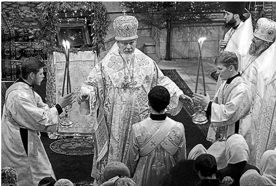
Рождество Христово в Покровском кафедральном соборе г. Самары. Январь 2004 г.

преподавал, был кандидатом наук и считал, что многие вещи делаю правильно, - но Владыка их почему-то не принимал. А он не принимал не сами вещи, которые я говорю или делаю, а мою необузданную волю смирял, потому что главное для священника - научиться слушать Бога, первая ступень к чему - смирение, послушание.