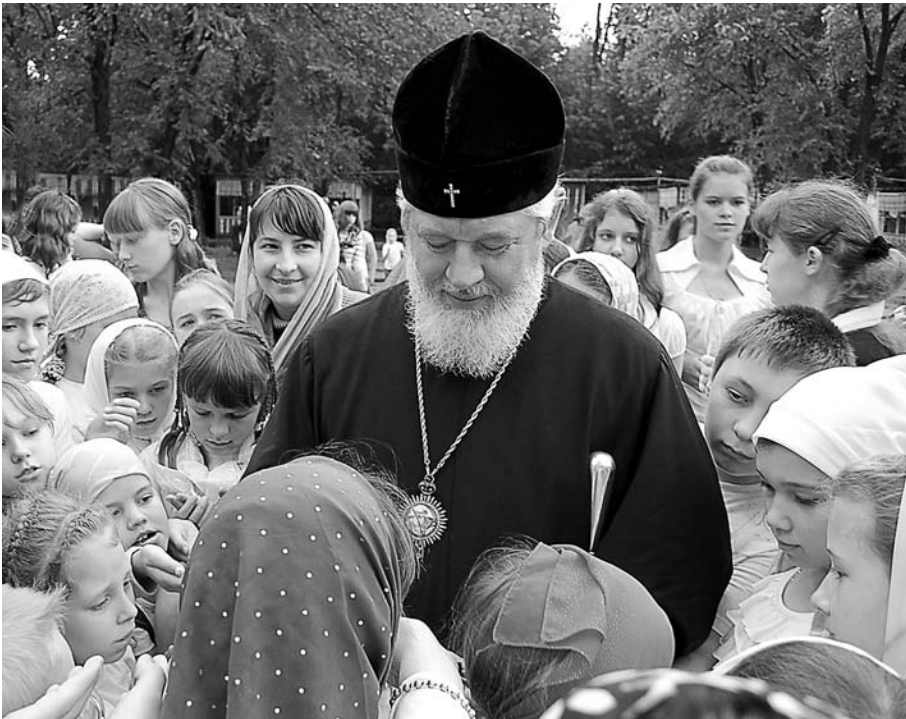
Православная смена в детском лагере «Волгарёнок». Июль 2011 г.

Владыка и дети, и взрослые желают Вам здоровья, добра и счастья. Но понимание счастья индивидуально. В Вашем понимании «счастье - это полная бытия». Поэтому мы от всей души желаем Вам полностью бытия на многая и благая лета!