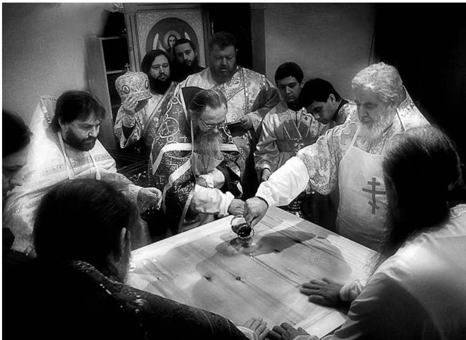
Освящение престола церкви в честь иконы Божией Матери «Знамение», городского подворья Заволжского Свято-Ильинского женского монастыря. Декабрь 2010 г.

прибыть Владыка. Запомнились его черные волосы с проседью, выразительный взгляд. Впечатление было такое свежее. Я близко подопы не решалась. Владыка Сергей сразу прошел в алтарь. После службы все мы поспешили взять у него благословение. Он всех благословил, сел в машину и уехал.