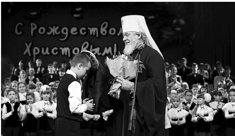
Митрополит Самарский и Сызранский Сергей на Рождественском концерте в Самарском академическом театре оперы и балета. Январь 2013 г.

одной из ярких в Русской православной Церкви. Если посмотреть на карту региона, наша Самарская земля по своим границам и контурам походила на сердце. Владыка Сергей это сердце заставил биться.